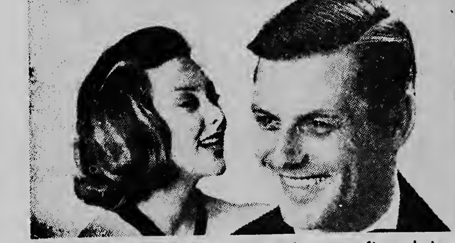
BRYLCREEM maakt Uw haar gezonder en geeft een beter zittende, natuurlijke vorm zonder het haar vet te maken

Gebruik BRYLCREEM, de moderne haarverzorging die de gehele dag een welverzorgd uiterlijk garandeert en Uw haar gezond en soepel houdt. BRYLCREEM verzekert succes en geeft U het mannelijk frisse uiterlijk dat zo door het vrouwelijke geslacht bewonderd wordt.